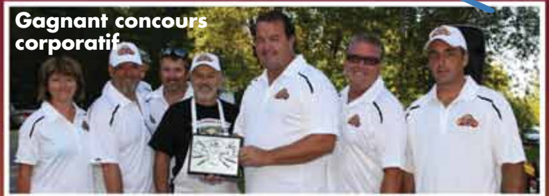
La Légion Royale